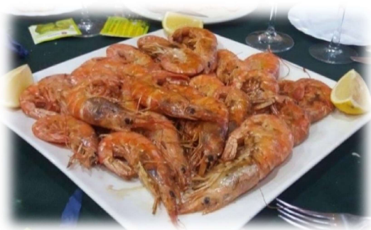
Gambón a la Plancha