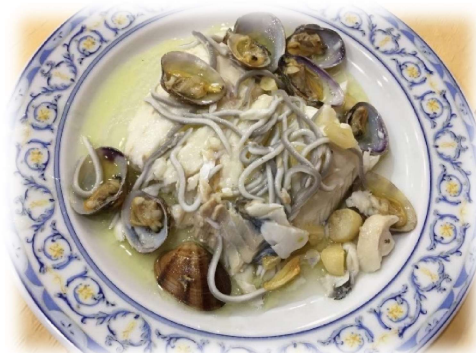
Merluza al horno con almejas y gulas