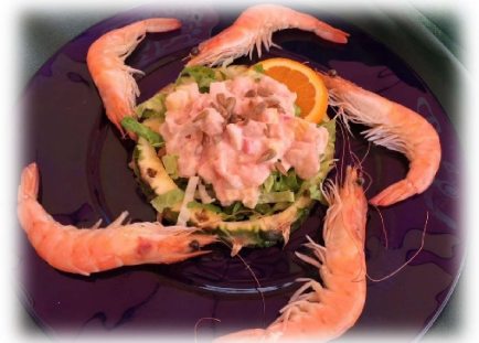
Cóctel de Piña tropical con langostinos cocidos