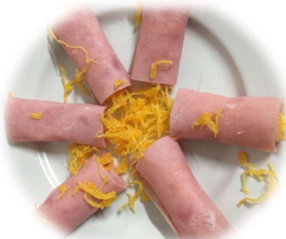
Rollitos de Jamón Cocido con huevo hilado