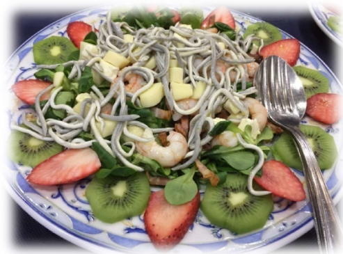
Ensalada de canónigos con gulas, beicon y frutas