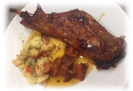
Paletilla de Lechal al Horno