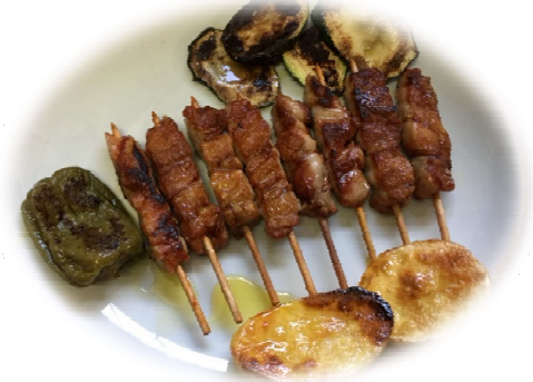
Pinchitos de pollo al curry