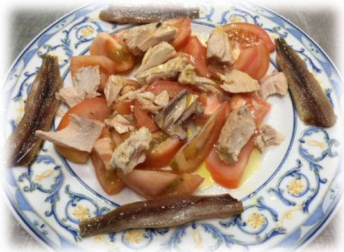
Tomate de la Huerta con Bonito y Sardina Anchoada