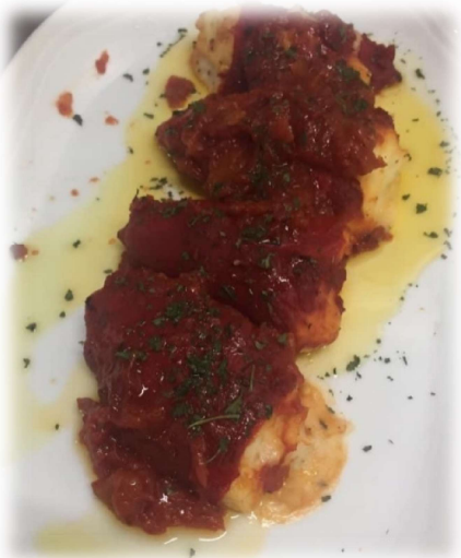
Pimientos de piquillo rellenos de bechamel de bacalao