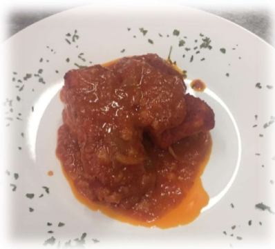
Bacalao a la Vizcaina