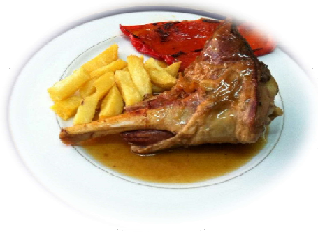
Cordero Asado al Horno a la Castellana