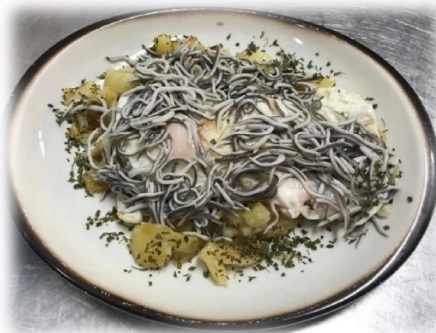
Huevos rotos con gulas sobre cama de patatas al montón