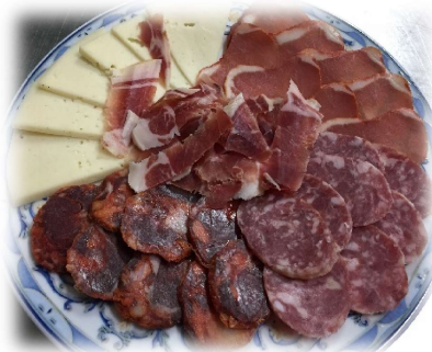
Tabla de Ibéricos y Serranos con Queso Manchego