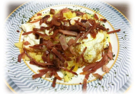
Huevos rotos con jamón sobre cama de patatas al montón