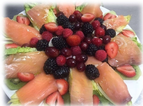
Ensalada de cogollitos y envidias con salmón ahumado